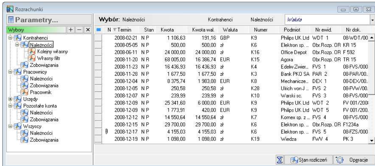
Rys. 2. Okno Rozrachunki